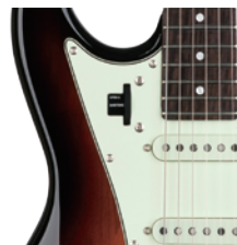
3 Tone Sunburst